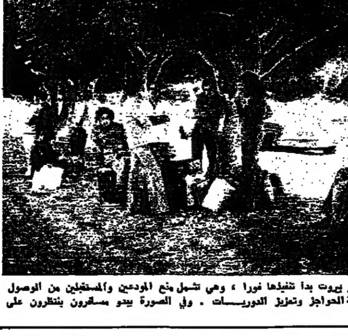
الاجراءات الجديدة لحماية مطار بيروت بدأ تنفيذها فورا ، وهي تشمل منع الوردمن والمستهبين من الوصول الى المطار ، بالاضافة الى اقامة الحواجز وتزليز الدوريات . وفي الصورة يبدو مسلحون ينظرون على طريق المطار وينتظر الرحيل .